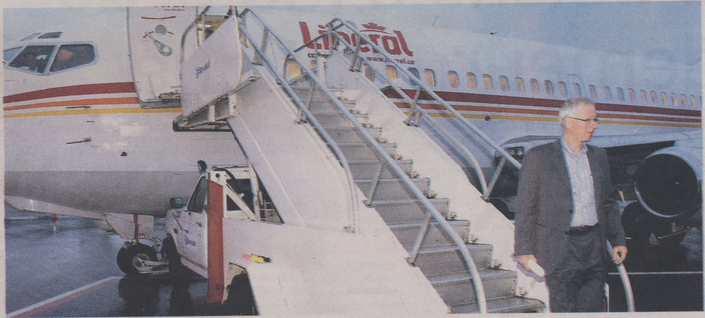
Pour compenser les rejets polluants de l'avion de campagne de Stéphane Dion, les libéraux ont acheté des crédits à la PME L2i.